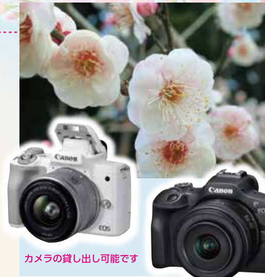
カメラの貸し出し可能です

【参加料】2000円(昼食代+保険料)【集合場所】梅園の里(安岐町富清2244)【定員】10名(最少催行2名)【持ってくる物】動きやすい服装、お持ちのスマートフォン(カメラで撮影した写真のデータの受取りが可能)【行程】11:00講座①→11:30昼食→12:30実写→13:15講座②→13:45写真鑑賞・アンケート記入→14:00終了