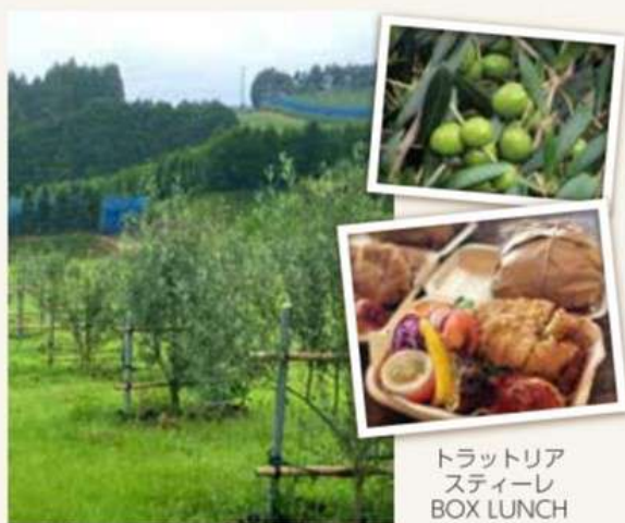
トラットリア スティーレ BOX LUNCH