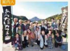
あらたに会の皆さん

【参加料】2300円【集合場所】上国崎公民館(国東市国東町見地1253番地1)【定員】15名(最少催行2名)【持ってくる物】エプロン、三角巾、タオル、持ち帰り用袋(大ジップロック等)【行程】9:30開始・説明→こんにゃくづくり→12:00 昼食→13:30 解散