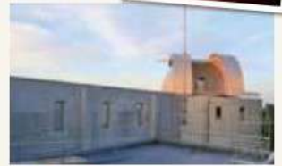
案内人 梅園の里 天球館

【参加料】1000円【集合場所】梅園の里 天球館(国東市安岐町富清2244)【定員】20名(最少催行2名)【行程】13:30開始・説明→太陽観測→15:30解散