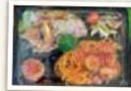
まるめキッチン特製弁当

【参加料】3000円【集合場所】まるめキッチン(国東市武蔵町成吉 622)【定員】10名(最少催行2名)【行程】10:00開始・説明→ヒンメリづくり(約2時間)→昼食→13:00解散