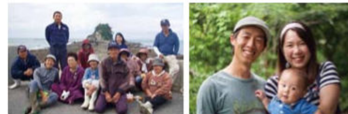
高島地区のみなさん