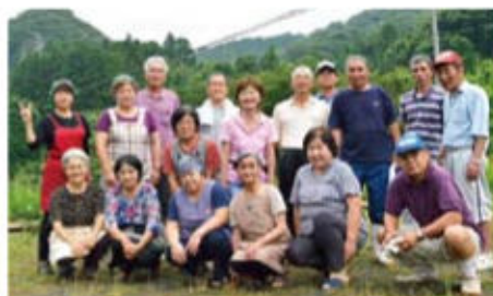
成仏桜会メンバー

豊かな緑の山間に成仏地区はあります。いつも笑顔の成仏桜会のメンバーが皆様をおもてなし。ウォーキングしながら芸術と歴史に触れた後は、窯焼きのピザや新米おにぎりで満腹に！成仏の人達とのふれあいを楽しみ、故郷に帰った気分で温かな一日をぜひお楽しみください。