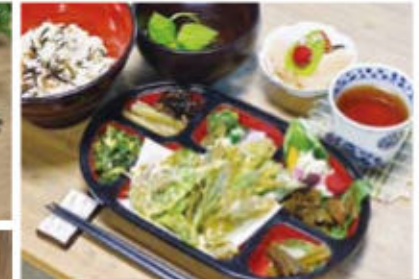
昼食は旬の薬草料理