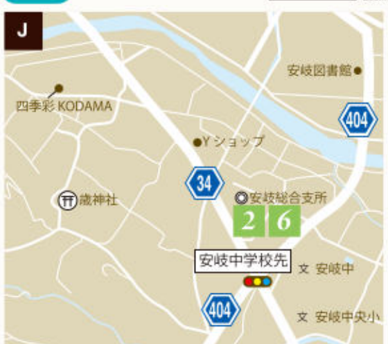
2 安岐総合支所 (p.5) 十三夜、古に思いをはせて みかん収穫とお月見の支度 6 安岐総合支所 (p.7) わんこ × トレイル ~愛犬とのトレイルデビューを国東で~ 【初級】密乗院の欄田トレイル