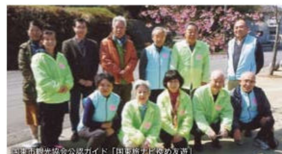
国東市観光協会公認ガイド「国東旅ナビ始め友達」

行程 9:00 集合→安国寺→飯塚城址→地主社→空也池→十王様 →興導寺で昼食、高木清玄について講話→桜八幡神社→15:00 頃 弥生のムラへ戻り解散 持ち物等 タオルや飲料水など持参。歩きやすい服装と靴で参加。 ※小雨決行 ※歩く距離は約 8km