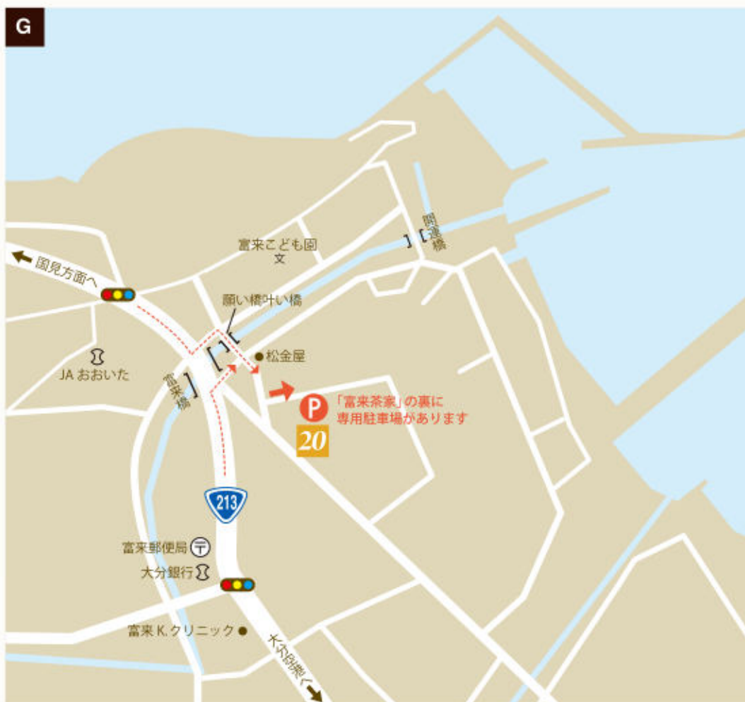
20 浜の混美仁 富来茶家 (p.14) 旬の薬草膳と、国東の自然を堪能する 「七島蘭工芸プラン」・「薬草摘みプラン」