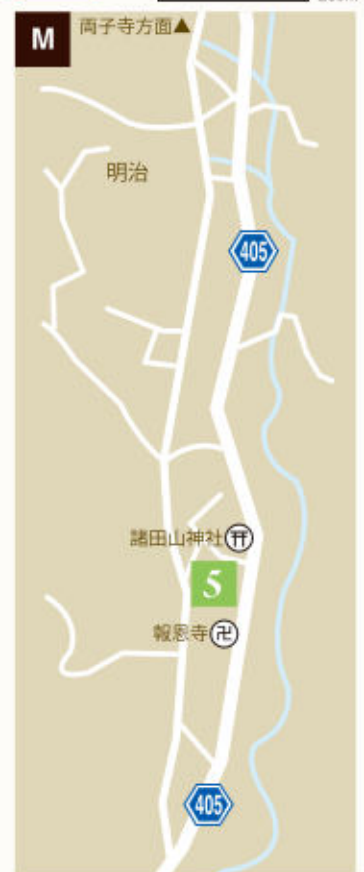
5 諸田御田植伝承館 (p.7) ノルディックウォークでゆく 里山の景色と秋のランチ