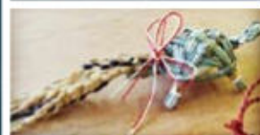
お正月飾り用の亀さんをプレゼント