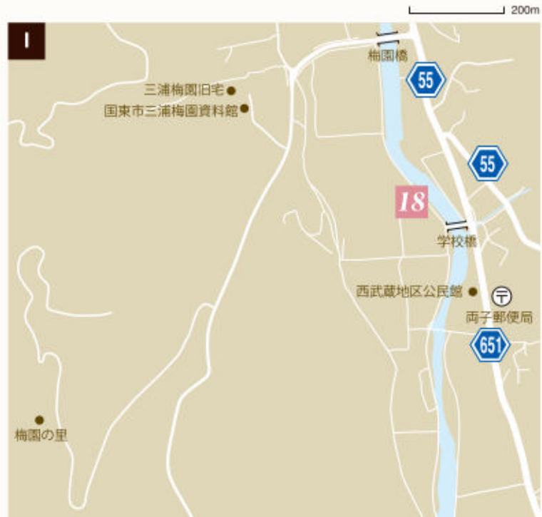
18 七島蘭學舎 (p.12) お部屋に季節を呼び込む 七島蘭オブジェ