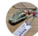
ミニ笑路(わらじ)のお土産付