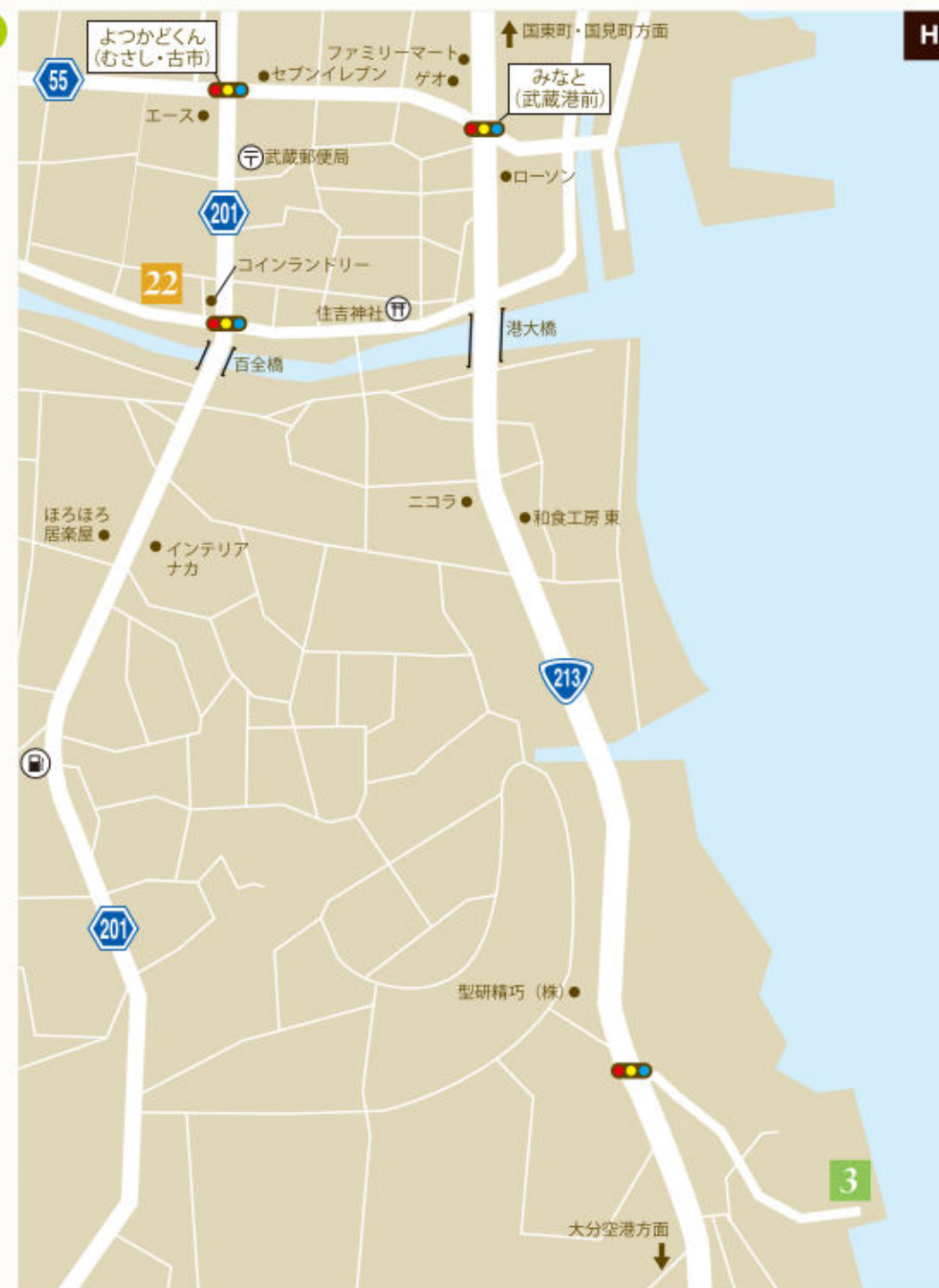
22 安永醸造 (p.15) 伝統の味を引き継ぐ老舗で 昔ながらの味噌づくり