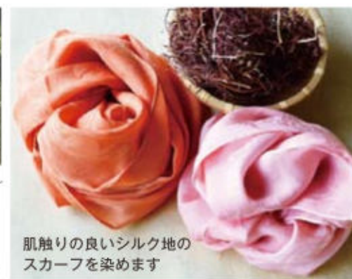
肌触りの良いシルク地のスカーフを染めます