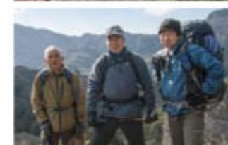
「国東半島峰道トレイルクラブ」がご案内します