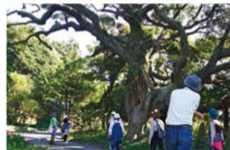
森のようちえんについて

「ほしのたね」ブログをチェック！ http://hoshi-no-tane.tumblr.com/