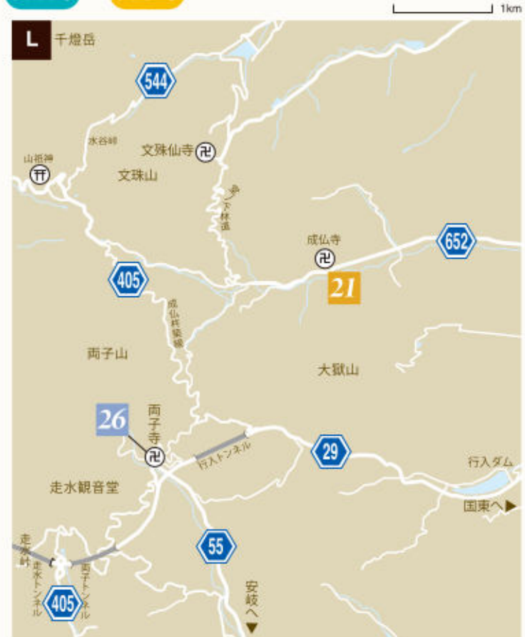
21 成仏区公民館 (p.15) 人情の里・成仏で アートと歴史探訪、ピザ焼き体験 26 両子寺 拝観受付所 (p.17) 護摩修行体験と精進料理で 心おだやかなひとときを