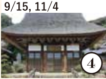
9/15, 11/4 泉福寺で禅入門 心を整える時間