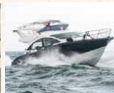
36ftのクルーザーボート