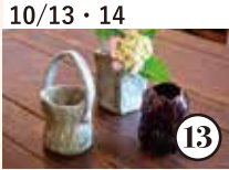
10/13・14 暮らしになじむ 小さな花入れを作ろう