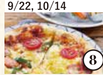
9/22, 10/14 アートと歴史、自然散策 成仏ビザ焼き体験