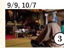
9/9, 10/7 興導寺でスピリチュアルな ひととき