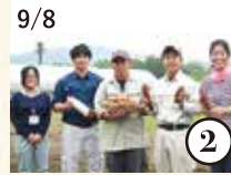
9/8 くにさき農業青年と 農業体験 & バーベキュー