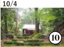
10/4 神宮寺 × 国東食彩 ZECCO プレミアムな創作会席