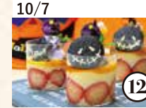
10/7 インスタ映える 簡単 ハロウィンプリン作り!