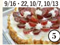
9/16・22, 10/7, 10/13 国東産・季節のフルーツで ケーキ作りとティータイム