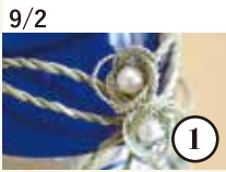
9/2 くにさき七島蘭 ボトルホルダー作り