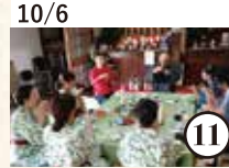
10/6 鶴川小町 角打ちミニ巡礼