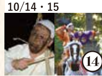
10/14・15 くにさきの旅 秋だ! 祭りだ! 国見だ!