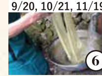
9/20, 10/21, 11/19 こんな植物から! 気軽に草木染めを楽しもう