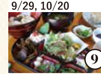
9/29, 10/20 国東の自然を学び、楽しみ、 七島蘭の畳で薬草膳を