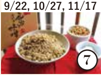
9/22, 10/27, 11/17 伝統の味を引き継ぐ 昔ながらの味噌作り