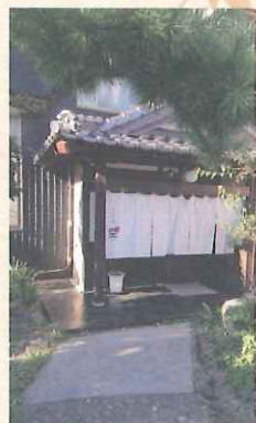
日本料理 空 CU