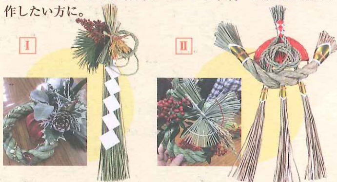
写真はイメージです