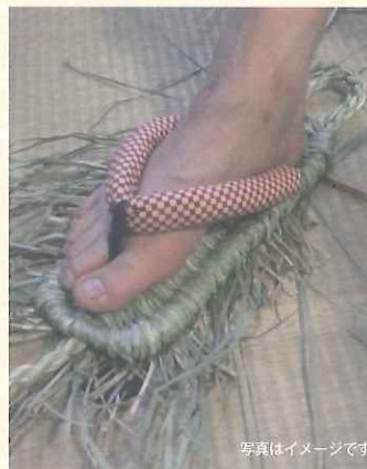
写真はイメージです

仏の里“国東”特産の貴重なくにさき七島藁でつくる本格的ぞうりづくり。上級者向けです。