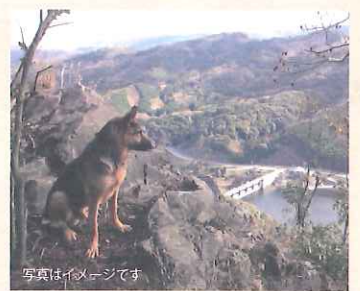
写真はイメージです

愛犬と自然の中で散歩を楽しみたい…でも必要な知識や装備がわからない…そんな愛犬家の方々にぴったりの企画です。そしてお昼は国東の食材を愛犬と共に味わってください。国東の自然・文化・食を運動しながら満喫してください。