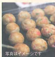
写真はイメージです