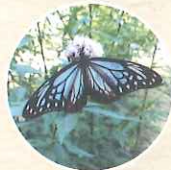
姫島に飛来するアサギマダラ