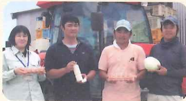
GROWERS くにさきメンバー

国東市内で農業や酪農を頑張る青年達と、土や野菜に触れバーベキューでにぎやかに過ごす1日。新鮮な卵と牛乳を使ったアイスクリーム作りも楽しめます。バーベキューには国東の特産品、桜王豚も登場。