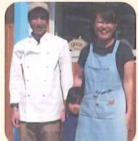
まるめキッチンのご家族