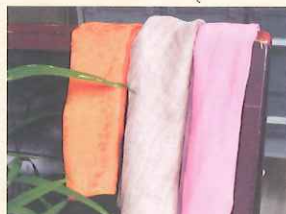
開催月によって染料が変わります！ 10月は笹、11月は西・びわの葉を予定。