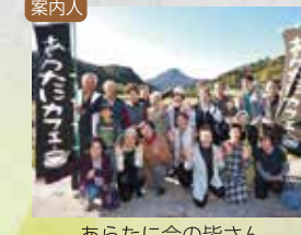
案内人 あらたに会の皆さん

上国崎地域を元気にする活動をしている「あらたに会」の皆さんと一緒に、国東のこんにゃく芋を使って「こんにゃく」を作ります。お昼にはあらたに会特製手作り弁当を頂きます。優しい人と風景に囲まれて、温かな時間を過ごしましょう。