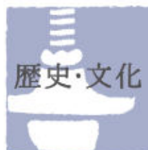
History & Culture