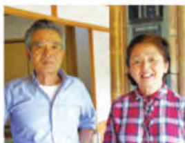
「うつわ舎あん」安倍夫妻