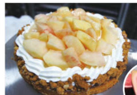
当日はイチジクを使用します